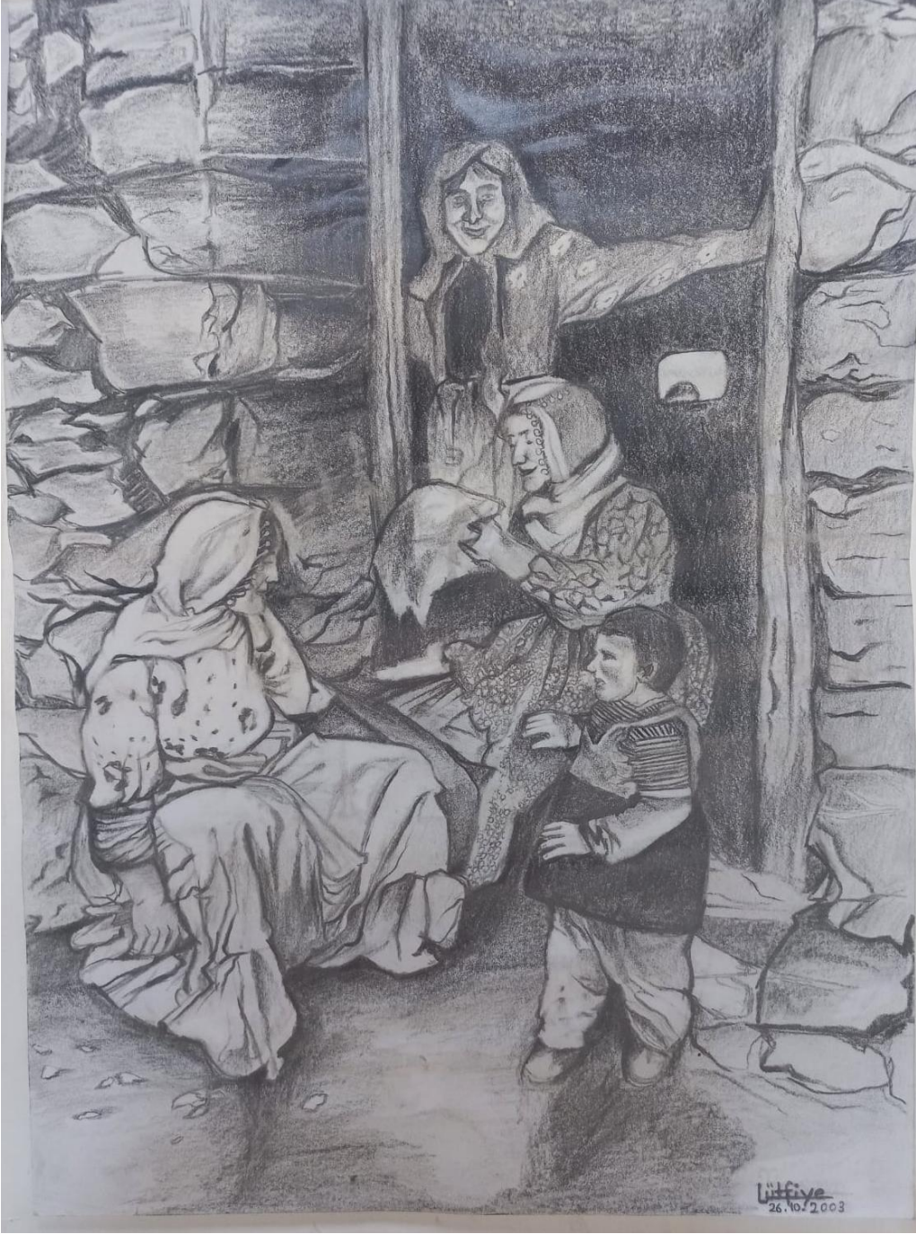
2. Taş Evin Eşiğinde