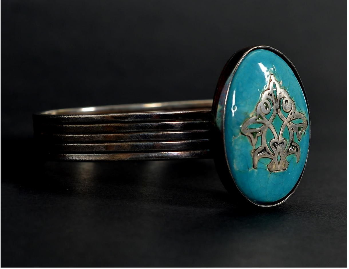
Silver inlaid bracelet

This technique, which has never been worked on before in the field of handicrafts, is a patented study and is the first product produced with this technique in the world. It is produced by placing pure silver into the cavity opened on the ceramic that has been pre-fired at 900 degrees Celsius, and glazing the silver with the enamel material used in jewelry, then baking it at 820 degrees Celsius.