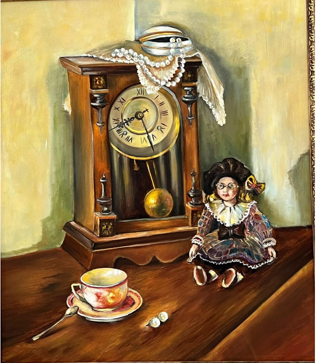
Traces of the Past