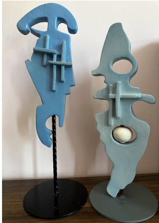
Key in me