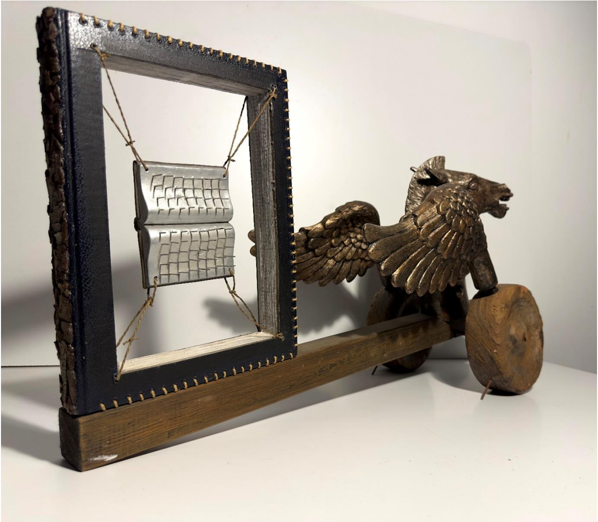
Nietzsche's Turin Horse

It Is A Work Designed By Nietzsche Based On A Tragic Event He Experienced In Turin, Italy.