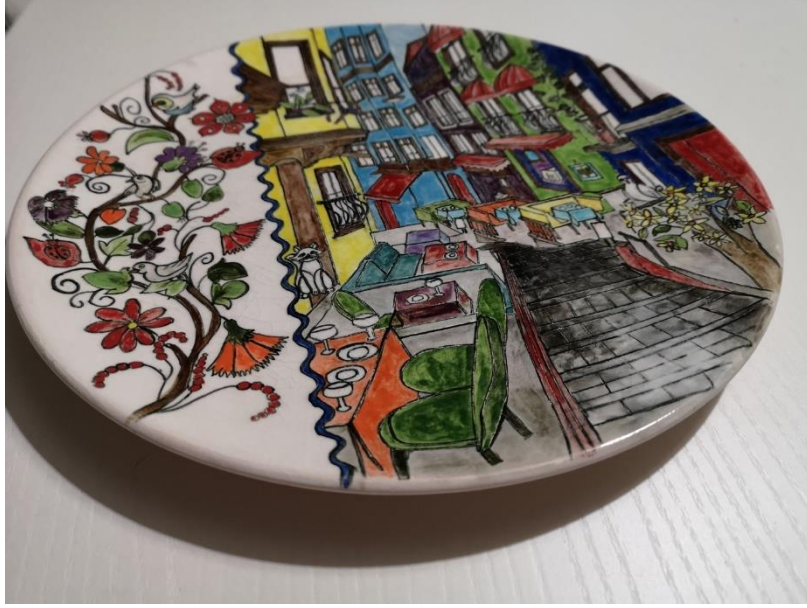
Algeria Street, Istanbul Tile Plate

The full biscuit of the 30x30 cm flat plate is completely handmade. It was produced in Kütahya. The tile paint, which is the madder paint on it, was obtained from Iznik. It is a part of the original series of Istanbul Tile Plates by Gülcan Kaçakgil, with its hand-painted technique, and it shows the multiculturalism of Istanbul and a modern reflection of the art of tiles. After the tile was made with the charcoal technique and hand painting, it was made usable with the original tile glaze and over glaze firing. It is suitable for decorative and daily use.